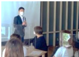
ワークスクール開校式での 市長あいさつ